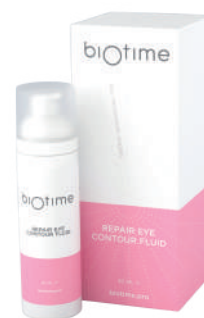
REPAIR EYE CONTOUR FLUID

Объем продукта: 30 мл Расход на 1 процедуру: 0,5-1 мл