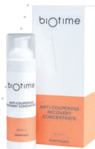
ANTI-COUPEROSE RECOVERY CONCENTRATE

Объем продукта: 30 мл Расход на 1 процедуру: 0,5-1 мл