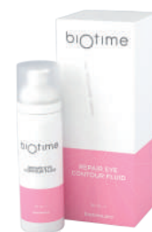
REPAIR EYE CONTOUR FLUID

Объем продукта: 30 мл Расход на 1 процедуру: 0,5-1 мл