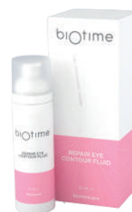
REPAIR EYE CONTOUR FLUID

Объем продукта: 30 мл Расход на 1 процедуру: 0,5-1 мл